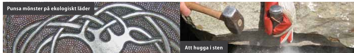
Punsa mönster på ekologiskt läder