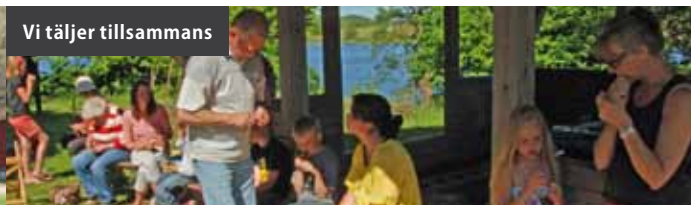
Vi täljer tillsammans