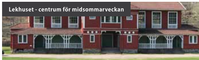
Lekhuset - centrum för midsommarveckan